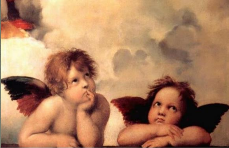
Ραφαήλ Σάντι Μικροί Άγγελοι

Οι άγγελοι είναι δημιουργήματα του Θεού.